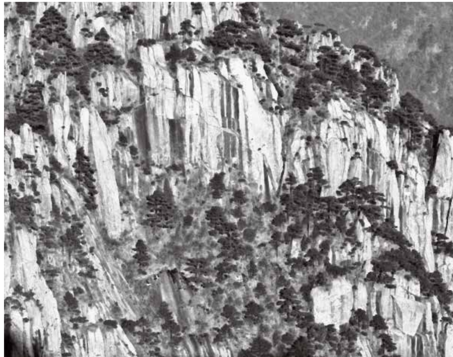
长满松树的崖壁