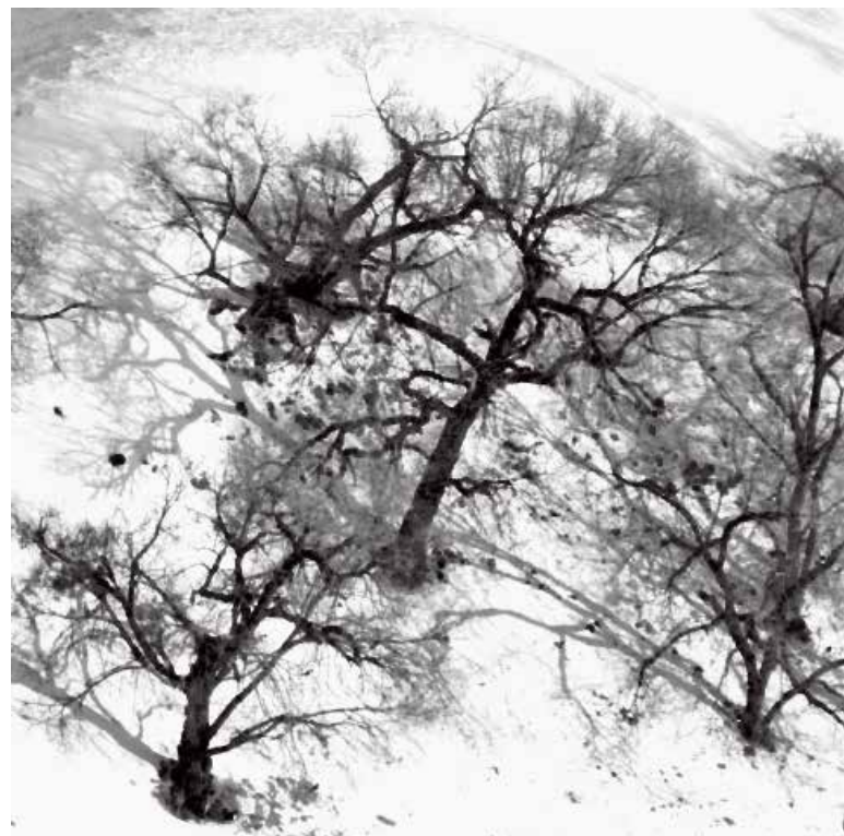
树影 (一)