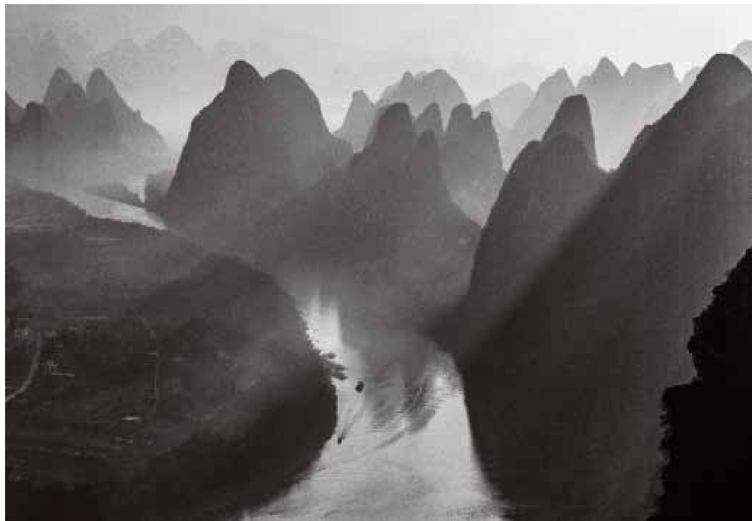
阳朔晨景